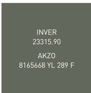
GRIS QUARTZ SATINÉ • 7039S