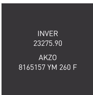
BRUN GRIS SATINÉ • 8019S