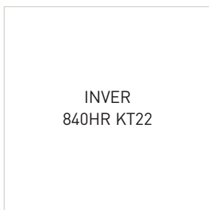
BLANC SATINÉ • 9016S