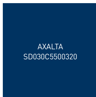
BLEU FONCÉ TEXTURÉ • 5003T