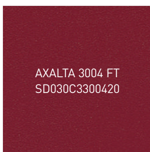
ROUGE TEXTURÉ • 3004T