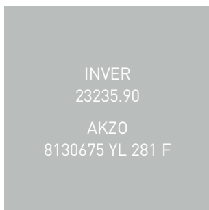
GRIS CLAIR SATINÉ • 7035S