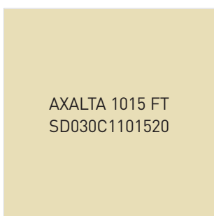
BEIGE TEXTURÉ • 1015T