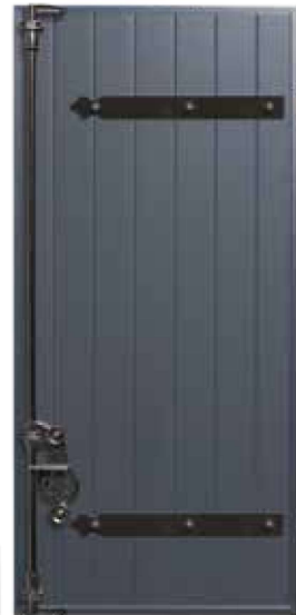
BAÏKAL Pentures, contre-pentures, lames verticales Gris anthracite RAL 7016