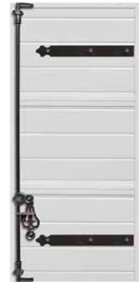
BAÏKAL Pentures, contre-pentures, lames horizontales Blanc RAL 9010