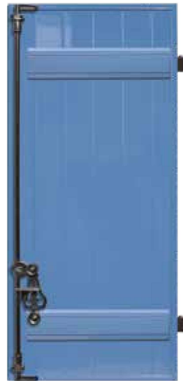
TAÏGA Barres seules Bleu pigeon RAL 5014